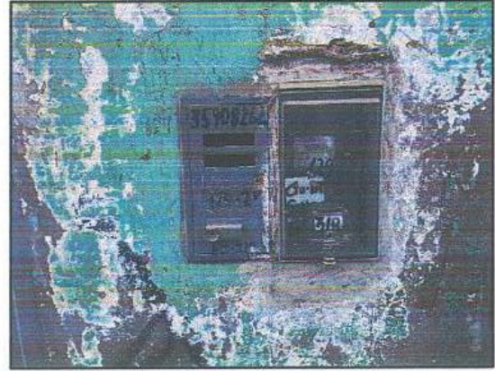
Fotografía 02: Medidor de Inmueble