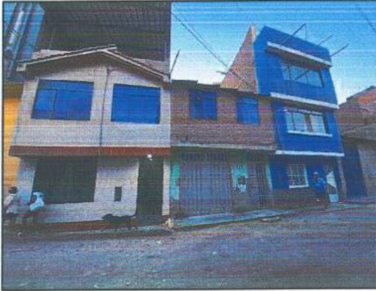
Fotografía 01: Fachade de Inmueble