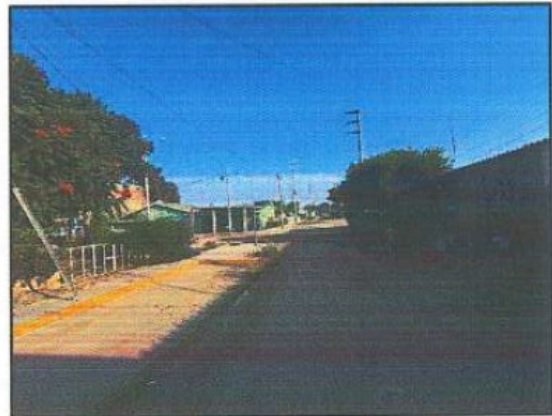
Fotografía 06: Entorno al Inmueble