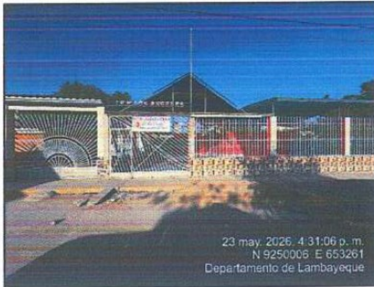
Fotografía 01: Fachada de Inmueble