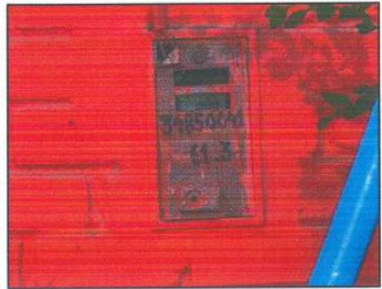
Fotografía 02: Medidor de Inmueble