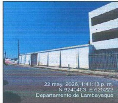
Fotografía 02: Entorno