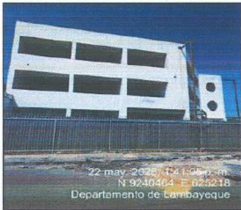
Fotografía 01: Fachada de Inmueble