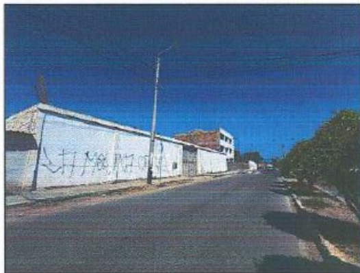
Fotografía 03: Entorno