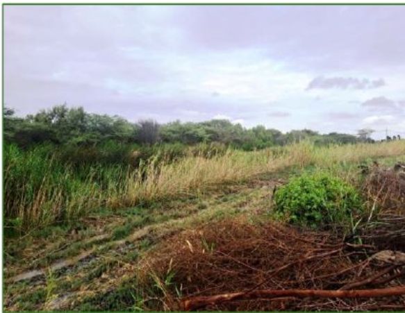
Vista de Parc. U.C. N° 51370