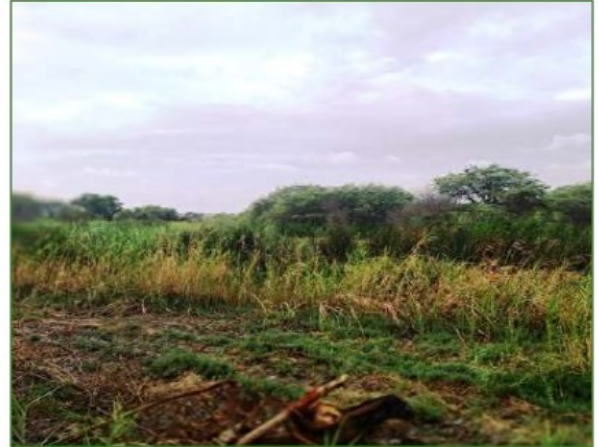
Vista de Parc. U.C. N° 5916451370