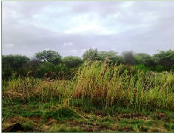
Vista de Parc. U.C. N° 51370