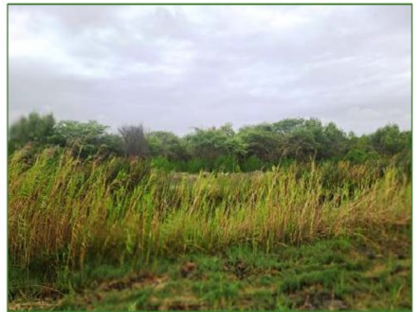
Vista de Parc. U.C. N° 51370