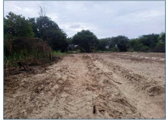
Otra vista Parc. U.C. N° 59164