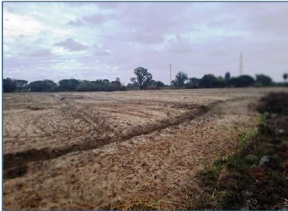
Otra vista Parc. U.C. N° 59164