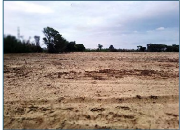
Otra vista Parc. U.C. N° 59164