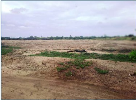
Parc. U.C. N° 59164