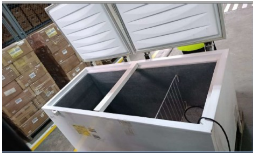
Congeladora comercial de dos puertas, marca Electrolux