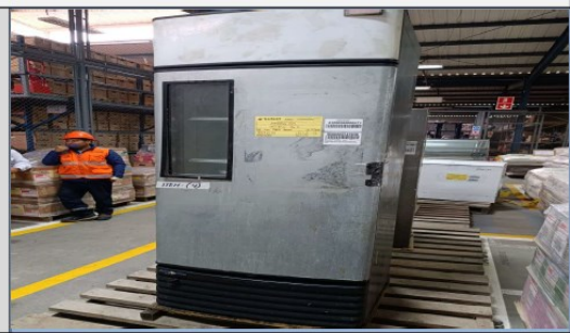
Refrigerador marca Fogel