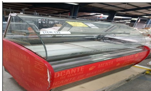
Vitrina de refrigeracion, marca Frinox