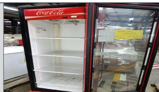
Visicooler de un cuerpo, marca Imbera