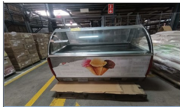
Vitrina exhibidora de helados