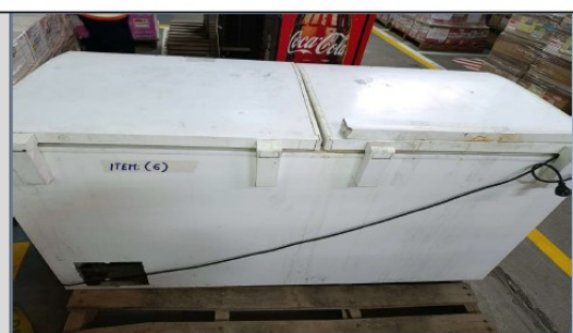
Congeladora comercial de dos puertas, marca Electrolux