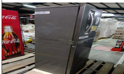
Refrigerador marca Electrolux