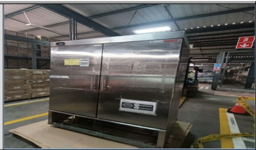
Camara de frio de dos puertas, marca Torrey