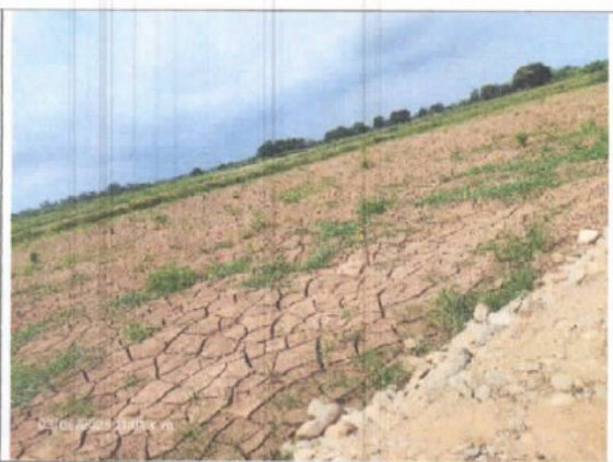
VISTA PANORAMICA DEL INMUEBLE