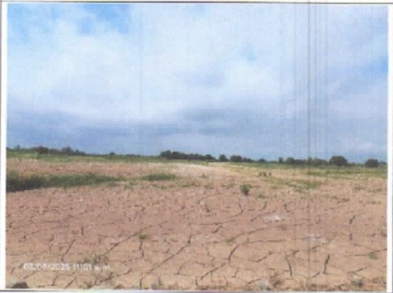
VISTA PANORAMICA DEL INMUEBLE