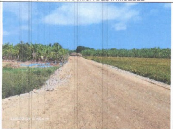
ENTORNO DEL INMUEBLE