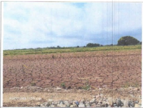
VISTA PANORAMICA DEL INMUEBLE